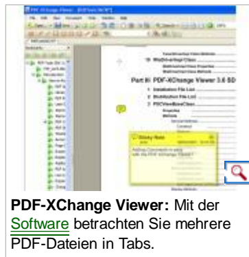
PDF-XChange Viewer: Mit der Software betrachten Sie mehrere PDF-Dateien in Tabs.

Bei PDF-XChange Viewer handelt es sich um ein freies Anzeigeprogramm für PDF-Dateien, dass aufgrund einiger Besonderheiten sicher schnell viele Anhänger finden wird. So werden alle Dateien der besseren Ordnung wegen in Tabs geöffnet und für eine Schnellübersicht gibt es eine Minivorschau aller offenen Dokumente.